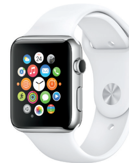
Apple Watch

iPhone den Kontakt zu ihren Kunden suchen.