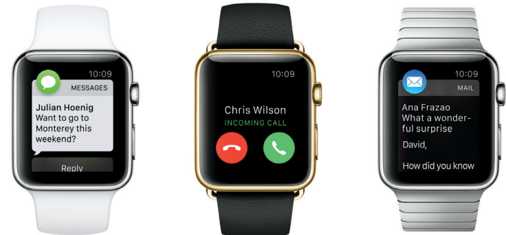
Apple Watch, Quelle und Copyright: Apple Inc.

Noch näher kommt man sich durch die Übertragung des eigenen Herzschlags. Dazu